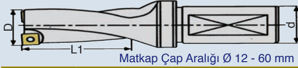
Matkap Çap Aralığı Ø 12 - 60 mm

Takma Uçlu KING Drill Matkaplar, İki Farklı Elmas Uç Montaj Uygulaması Sayesinde Geleneksel Tiplere Göre % 50 Daha Hassas Toleranslar, Yüksek Hız ve Performans Sunmaktadır. Uzun Boylu Matkaplarda Kullanım Değerleri %30-40 Düşürülmeli.